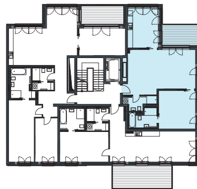
Lage im Geschoss