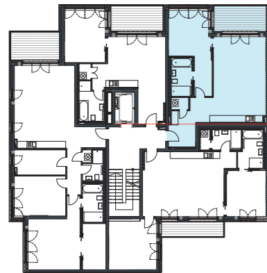
Lage im Geschoss