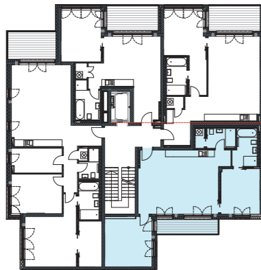
Lage im Geschoss