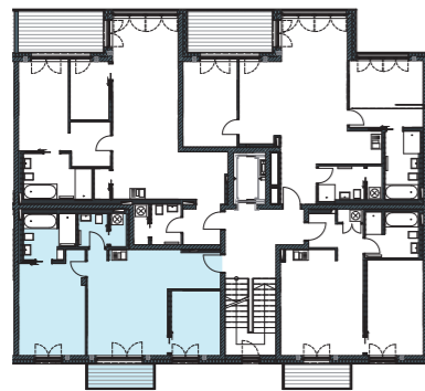
Lage im Geschoss