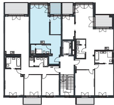
Lage im Geschoss